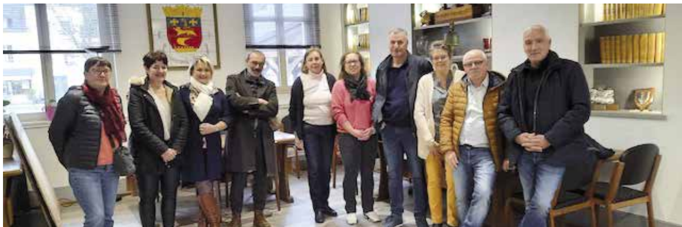
Moment de convivialité à la Mairie pour clore la campagne du recensement

En répondant aux questionnaires, vous avez contribué au bon déroulement de cette opération et nous vous en remercions vivement. En comprenant les enjeux d'une enquête la plus exhaustive possible, vous avez agi dans l'intérêt de notre commune et fait acte de civisme. Nous ne manquerons pas, dès que les résultats officiels seront connus, de vous en rendre compte dans notre magazine communal.